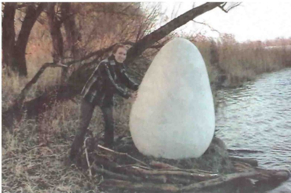
Mehr als 150 Zentimeter hoch und einige Zentner schwer ist der Metallkörper in Ei-Form, der am Elbeufer bei Neu Darchau liegt. Auch Imke Bodendieck rätselt, woher das Ei kommt und wie es zu der abgelegenen Stelle transportiert worden ist.

► Sachdienliche Hinweise nimmt die LZ-Redaktion unter landredaktion@landeszeitung.de entgegen.