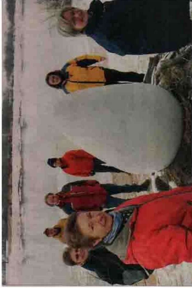
Gestern haben die Landschaftskünstler vom Hof Tangsehl ihr überdimensionales Ei von der Elbe bei Neu Darchau fortgebracht.

„Unsere Grundidee ist es, Objekte in die Landschaft und den Naturkreislauf zu integrieren“, sagt Elster-Larsch. Dabei stehe nicht die Kunst im Mittel-